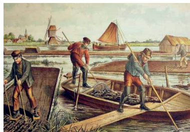
Schoolplaat veenbedrijf: veentrappen, turfsteken, baggeren en drogen