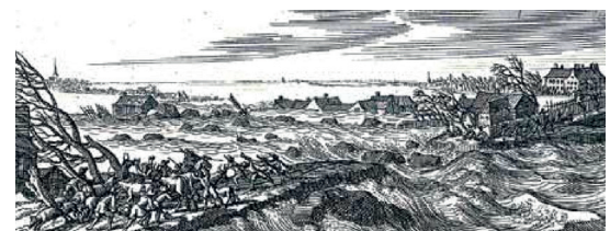
Doorbraak van de Spaarndammerdijk bij Halfweg, november 1675