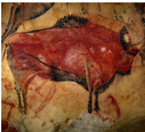
Grottekening van Altamira