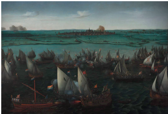
Het schilderij de Slag op het Haarlemmermeer, geschilderd door H.C. Vroom, te zien in het Rijksmuseum