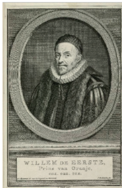
Willem van Oranje